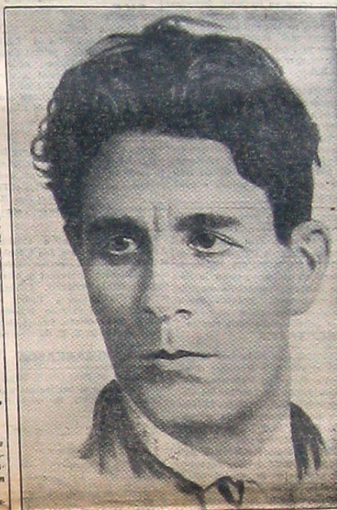
Ca om, care nu făcuse decât să iasă din mormântul lui, mă vedeți acum, când noi pășim în a doua decadă de luptă.

Ne-am apus aci totdeauna gândul nostru pe față și fără ocoluri și mai ales fără subtilități dialectice. Dorim ca Statul nostru să devină un Stat Național, așa cum au dorit-o toți cei ce au luptat și murit Pentru învierea Daciei Traiane, una și indivizibilă dela Nistru până la Tisa. Vrem deci o Românie liberă, căpătând în hotarele ei tot neamul românesc.