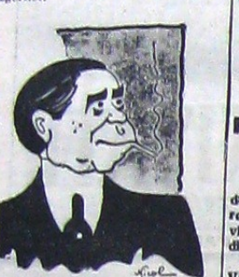
D. G. TĂTĂRESCU

afecțiunea României într-o obiceiă deosebită.